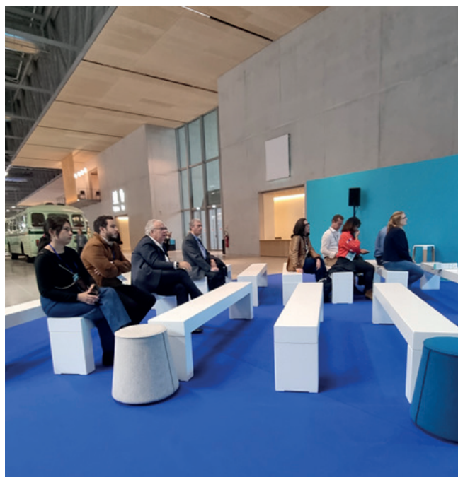
Figura 3 - Parte del pubblico presente allo speech di CIFI Servizi.

La partecipazione a questo evento estero è stata utile per farsi conoscere a livello internazionale e per acquisire informazioni e novità.