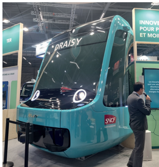
Figura 4 - Uno dei nuovi veicoli tramviari esposti a EuMo.