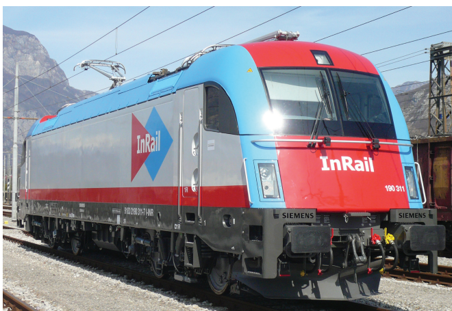
Fig. 1 - Eurorunner ER20